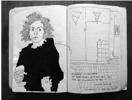
Karina Beumer, KB.ZLH2014 55 Rolli: Lotte, pen en inkt op papier, 30 x 21 cm

Niet altijd. Maar doorgaans wel. Meestal heb je een onderwerp, of een thema. Je kan veel ingangen kiezen om bij je thema komen. Maar het is wel prettig om te proberen daarop aan te sturen. Tegelijkertijd moet je tussen de regels